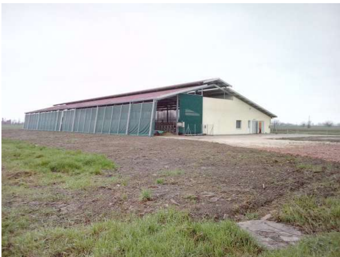
FOTO 6 – Prospetto Nord-Est stalla esistente dove è previsto, sal lato sinistro, l'ampliamento della stalla