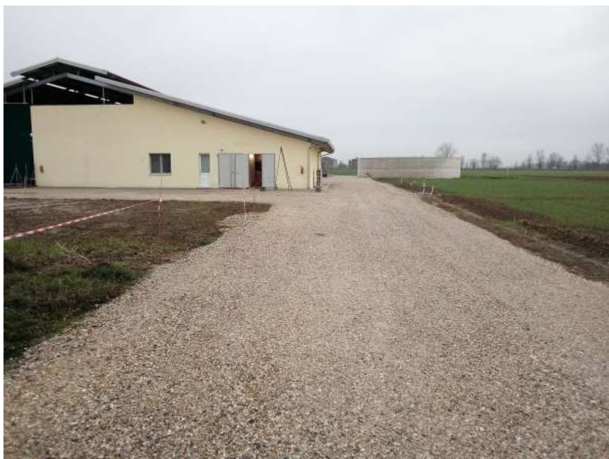
FOTO 4 – Vista stalla e vasca reflui esistente – a destra dello stradello ghiaiato sono previsti la concimaia, l'ulteriore vasca reflui ed il nuovo fienile