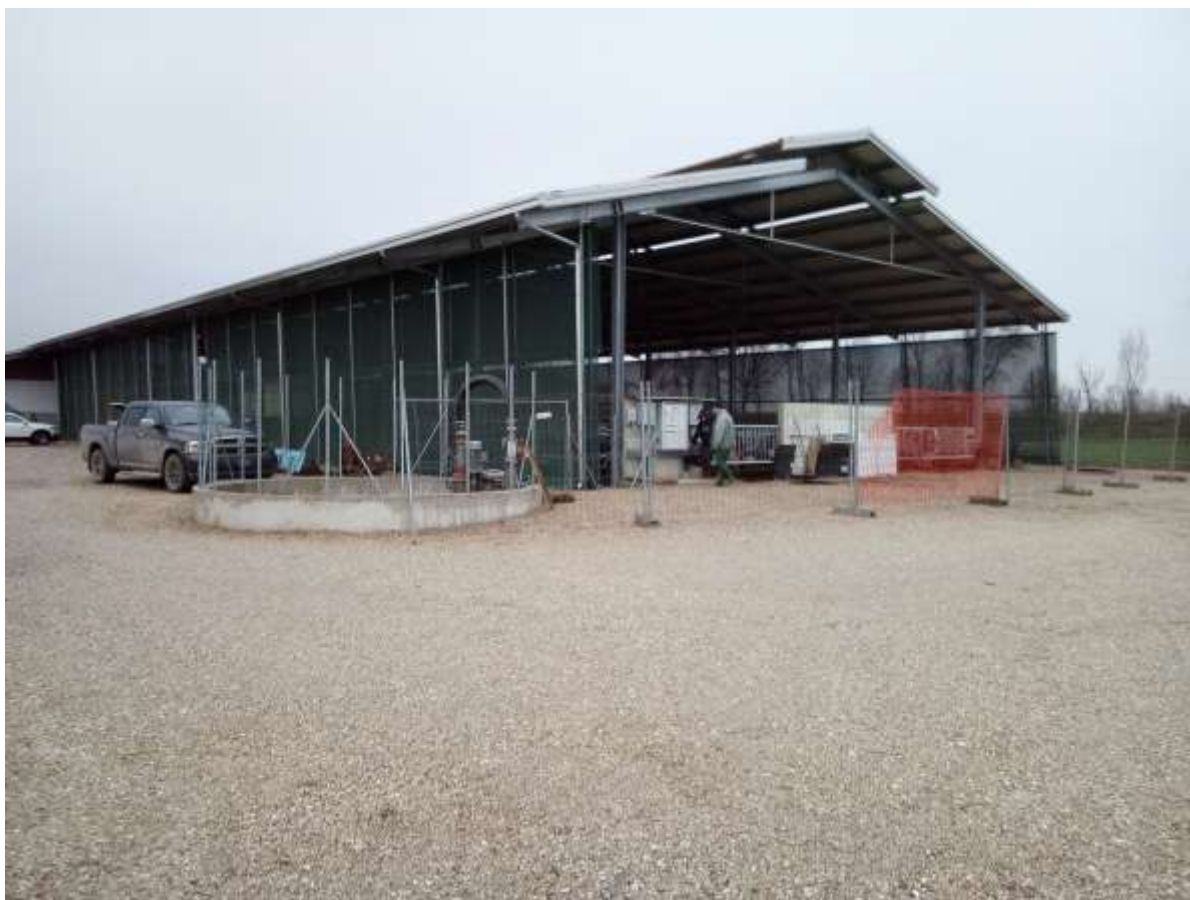
FOTO 8 – Prospetto Sud-Ovest Stalla esistente con prevasca in primo piano