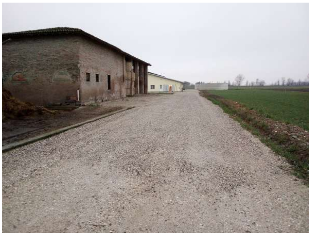
FOTO 2 – Stradello di accesso ghiaiato di accesso alla stalla e fienile esistenti