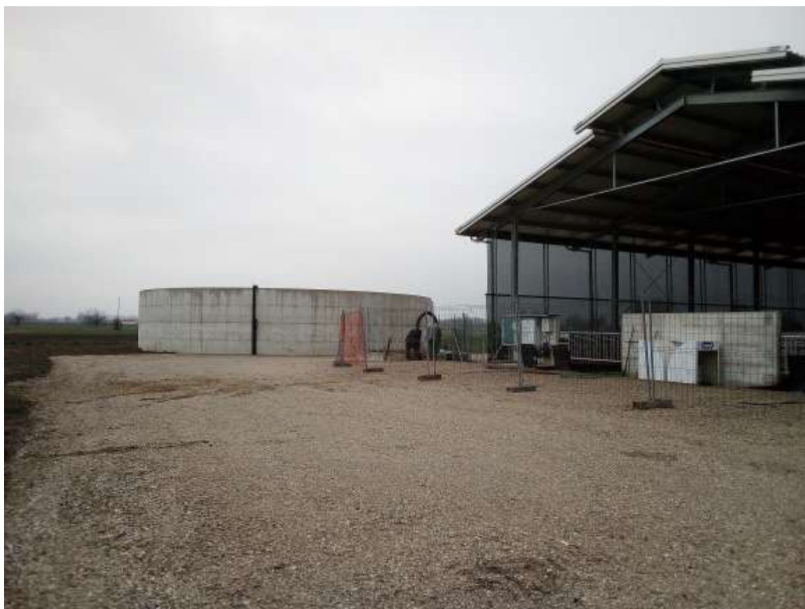
FOTO 9 – Prospetto Sud Stalla esistente con vasca reflui in secondo piano