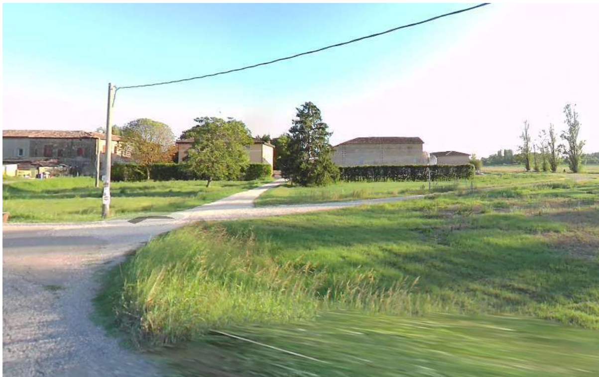
FOTO 1 – Ingresso al Fondo Agricolo da Via Gazzoli; a sinistra stradello di accesso alla parte storica e residenziale, a destra stradello di accesso alla stalla e fienile esistenti