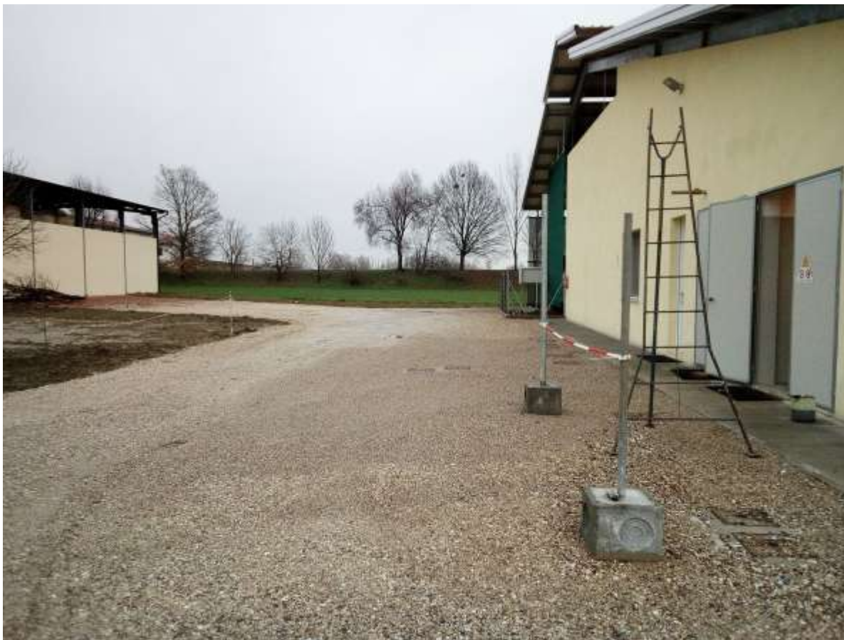
FOTO 7 – vista del fronte Nord della stalla esistente e del fronte Sud del fienile metallico esistente