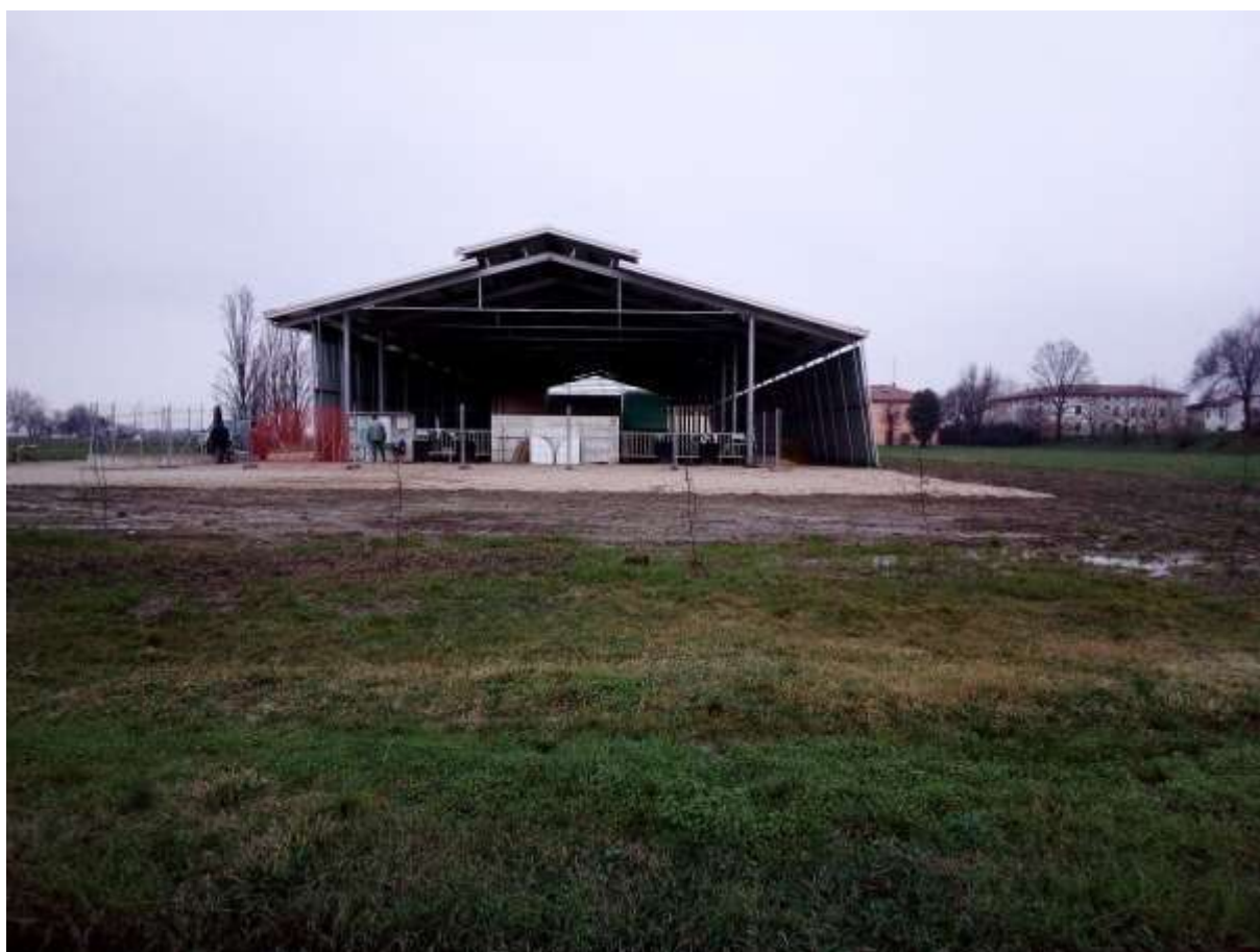
FOTO 12 – Prospetto Sud Stalla esistente – a destra della stalla esistente è previsto l’ampliamento in progetto