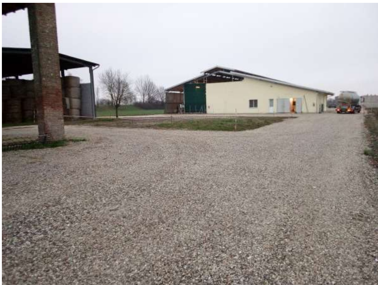
FOTO 3 – Stradello di accesso ghiaiato di accesso alla stalla e fienile esistenti