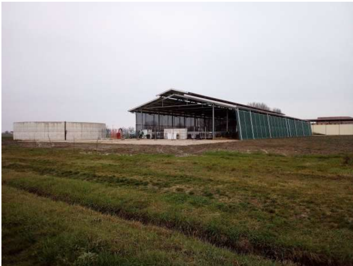
FOTO 11 – Prospetto Sud-Est Stalla esistente – a destra della stalla esistente è previsto l’ampliamento in progetto